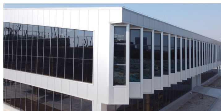
三维智慧医疗系统区域总部金属面围护系统安装案例