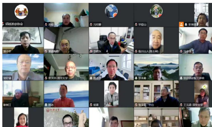
中国钢结构协会团体标准《工业钢结构工程检测与评定技术规程》送审稿通过审查